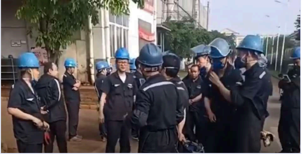
四川绵阳好圣工人抗议绩效问题