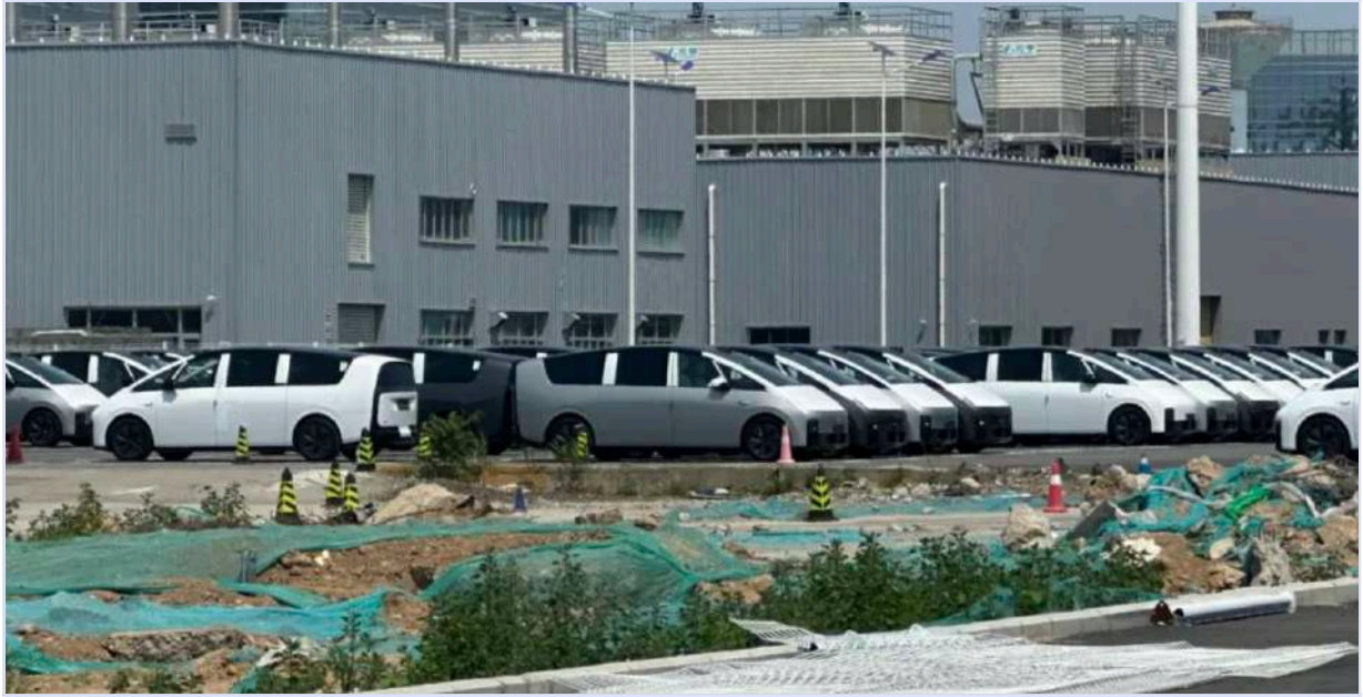
理想汽车北京顺义工厂

5月初，国产电动车主要品牌之一的理想汽车开始进行秘密大裁员。对于这次裁员，公司不直接宣布范围和名单，而是每天只通知一小部分员工，让每位员工都高度紧张，近似于“抽奖”。有员工估计，从5月初开始，理想的裁员人数已经高达万人，约占其总人数的三分之一。而在裁员过程中，理想公司也倾向简单粗暴，不给员工谈判机会，要么指出员工违反员工手册，要么直接给出一纸“单方面解除合同”。近年来，大厂裁员越来越频繁，公司的手段也在进化。 阅读原文