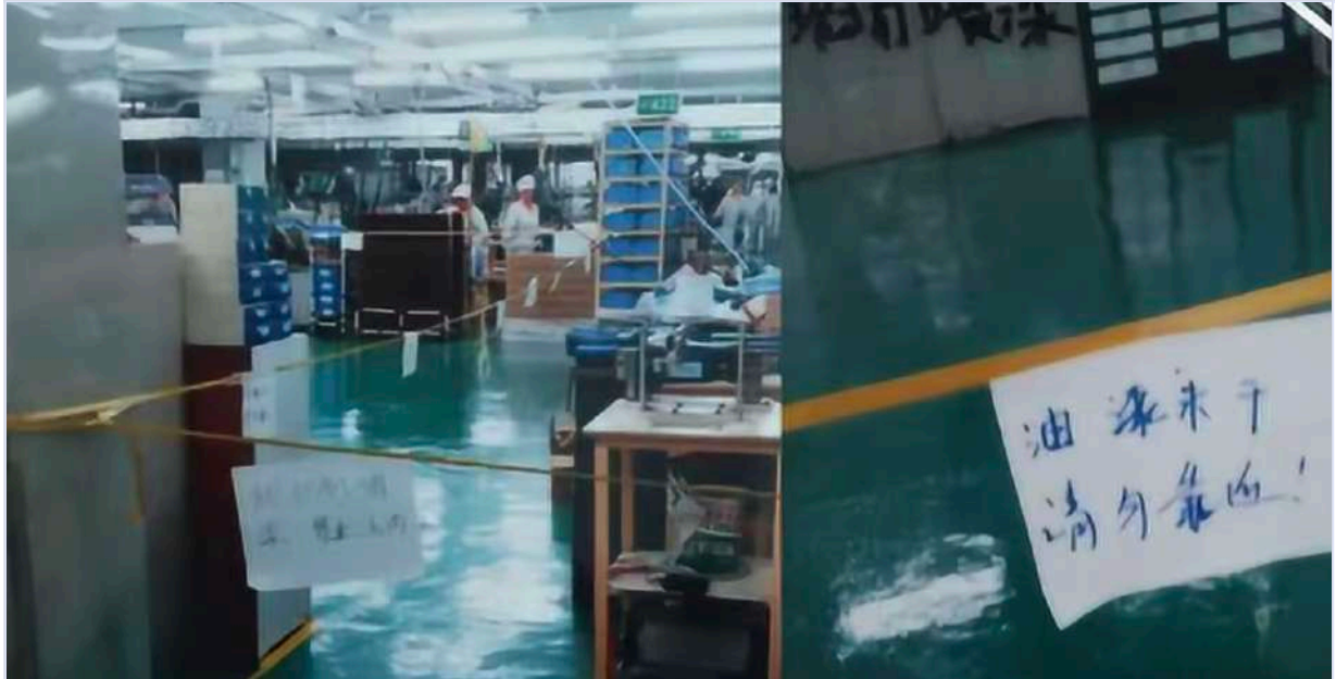
2019年，深圳一汽配厂5名工人被爆出患白血病

职业病和工伤是劳动者在工作中经常面临的身体问题。与更多突发、急性形式产生的工伤相比，职业病是在较长时间内积累形成的慢性损伤，难以及时察觉。