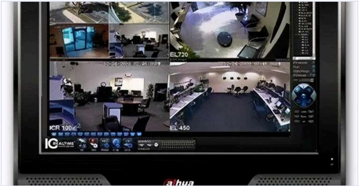
网传某互联网公司办公室监控视频截图

这并不是拼多多首次压榨员工，此前拼多多就以高度监视、控制员工而闻名。侵犯员工基本权益的现象不胜枚举，极其恶劣：从招聘阶段开始排斥会发声的员工，逼迫员工签约“自愿每月工作三百个小时内部协议”、用特殊办公椅监视员工如厕时间（ 来源 ）、在办公区安设360度摄像头监控（ 来源 ），不让员工之间透露部门或真名、禁止同事组建微信群等等诡异操作而臭名昭著，后果严重时甚至导致多名年轻员工猝死、自杀。（ 来源1 ， 来源2 ）