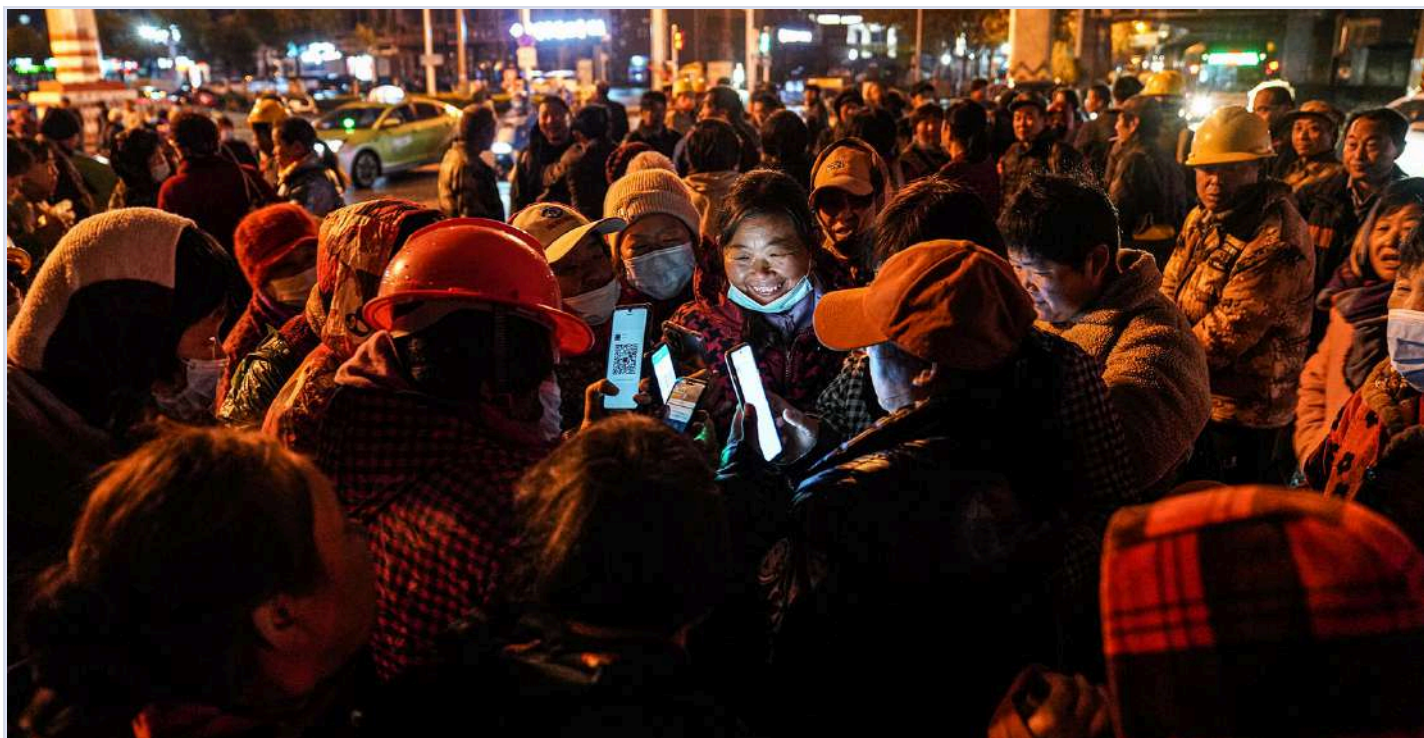
凌晨，在张大郢村附近自发形成零工市场，日结工们举起手机，添加招工者的联系方式。