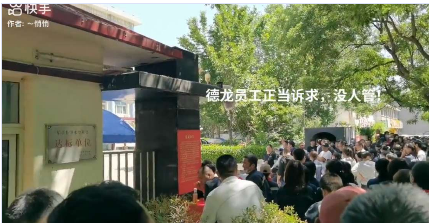
河北钢铁大厂唐山德龙关停，3100余名工人失业