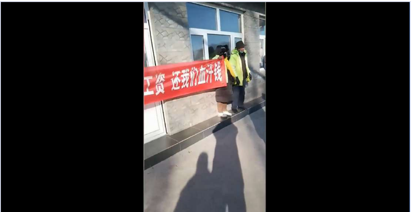
环卫工抗议河北轩昂环卫公司拖欠17个月工资，