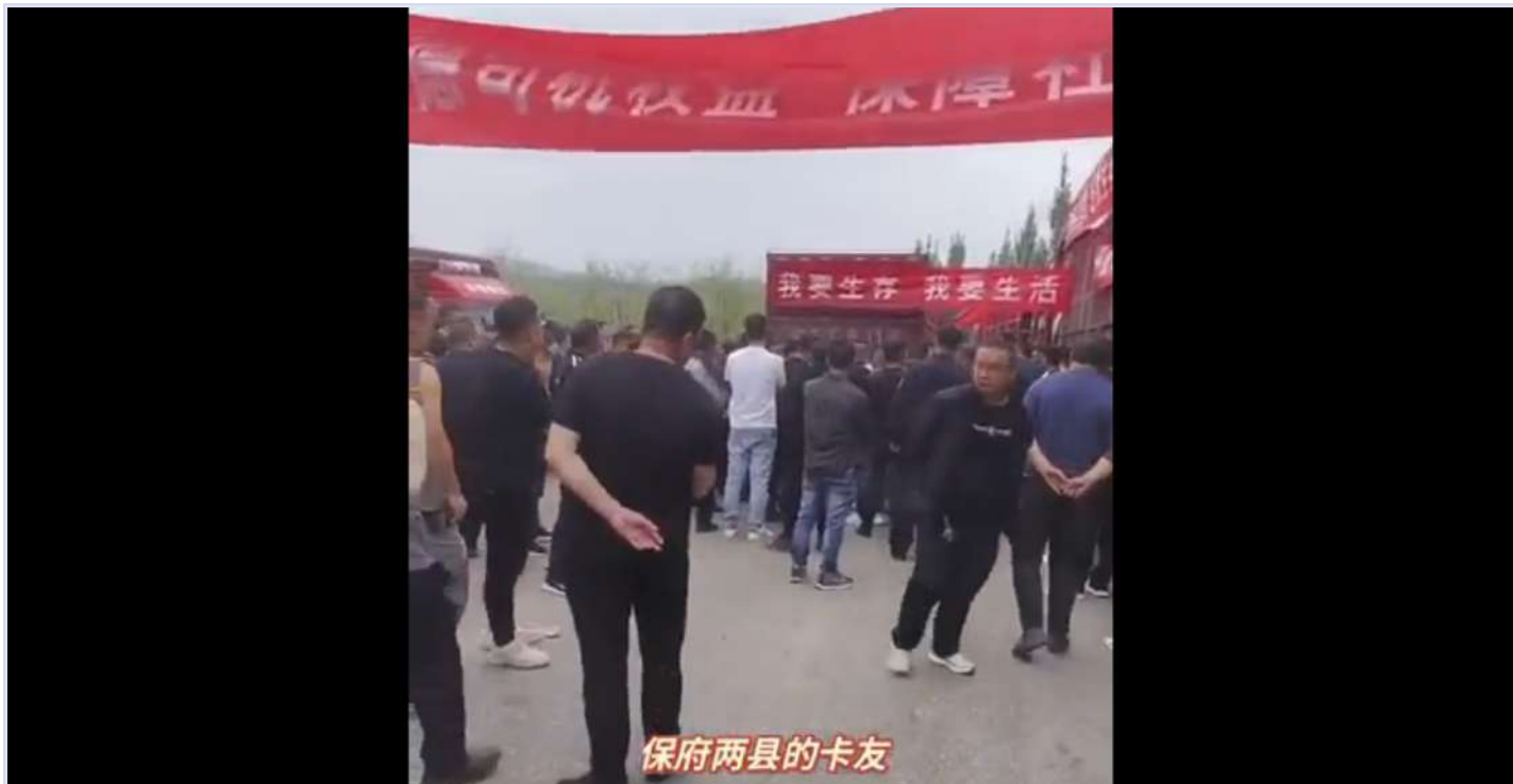
5月山西省数百名卡车司机罢运，抗议物流园对司机的违规收费罚款