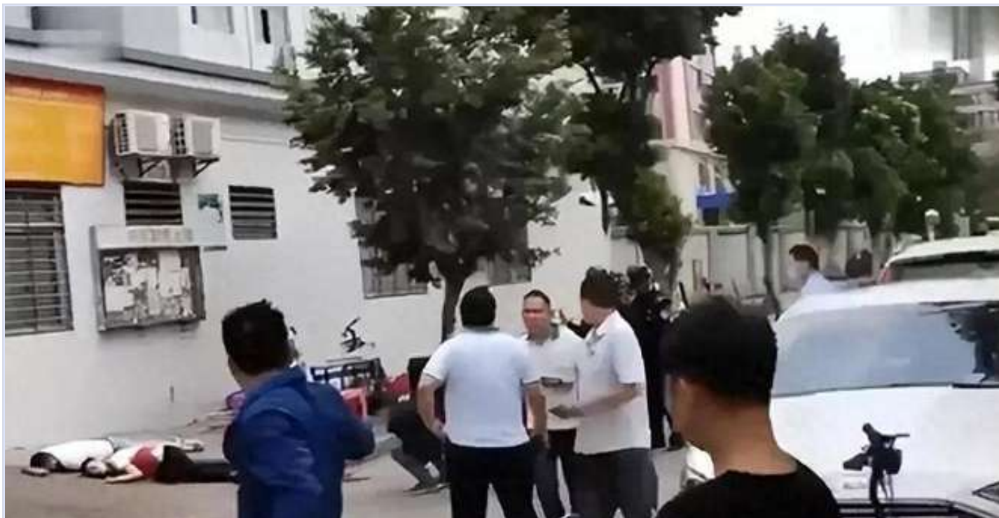
网传东莞一工人当街杀死黑中介现场