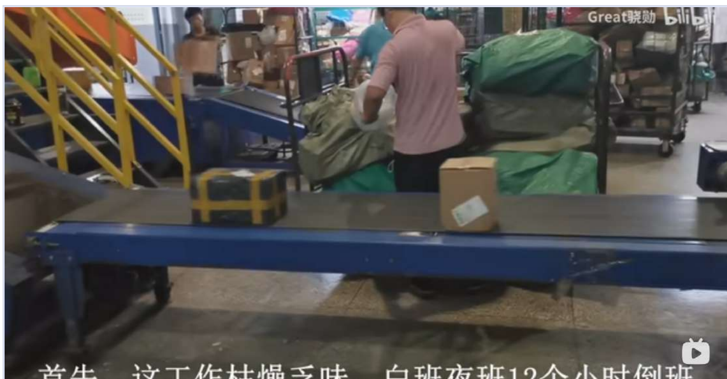
物流装卸工晒出自己的工作环境和内容

但说实话，这个活根本就不是人干的。我不是说骂人的，我是真的很心疼这些人，但我没办法，我自己为了生活我去招工，因为它毕竟存在，你不干人家也会去干。现在天气很冷了，有些人穿羽绒服、穿棉袄。但是，装卸工就穿个短袖就能干了，没有空调啊，他就穿个短袖而已。我的意思不是说他们没衣服穿，而是因为他们穿衣服会非常热。他们穿衣服浑身都是蒸汽在那冒，每个人都跟“超级赛亚人”一样。