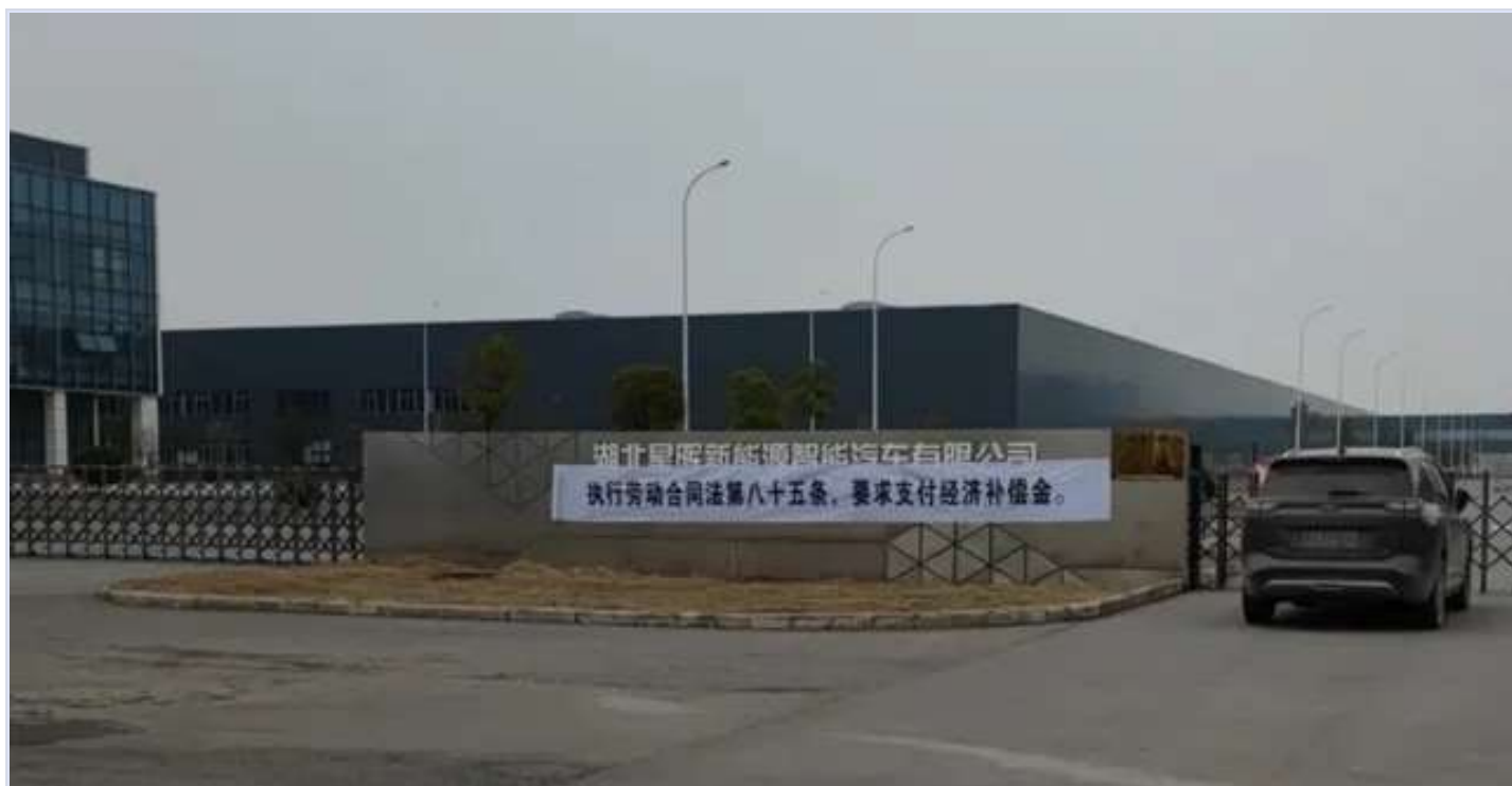
威马汽车欠薪，遭员工拉横幅讨薪

现在很多人都奴性化了，他不能够改变这个现状，都适应这个现状了。但在那些奴隶当中，还是有提要求的SB，就跟我一样。说件小事情。我们宿舍区和厂区连在一起，厂区不让穿拖鞋。有人出宿舍穿个拖鞋，保安不让进来。后来那人就和保安吵起来了，后来还报警，说既然是宿舍，那为什么不能穿拖鞋呢？难道下班了还要穿个鞋子？我还不能舒服一下自己的脚吗？经过这么一闹，现在都允许穿拖鞋了。这就是说，利益的争取都是抗争而来的。但是很多人都想等待别人来抗争，自己来看笑话，所以说，社会进步很难的。