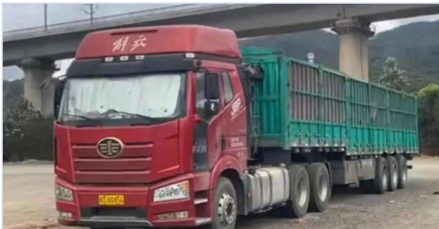
赤峰货车司机被发现死在停车场内，涉事货车