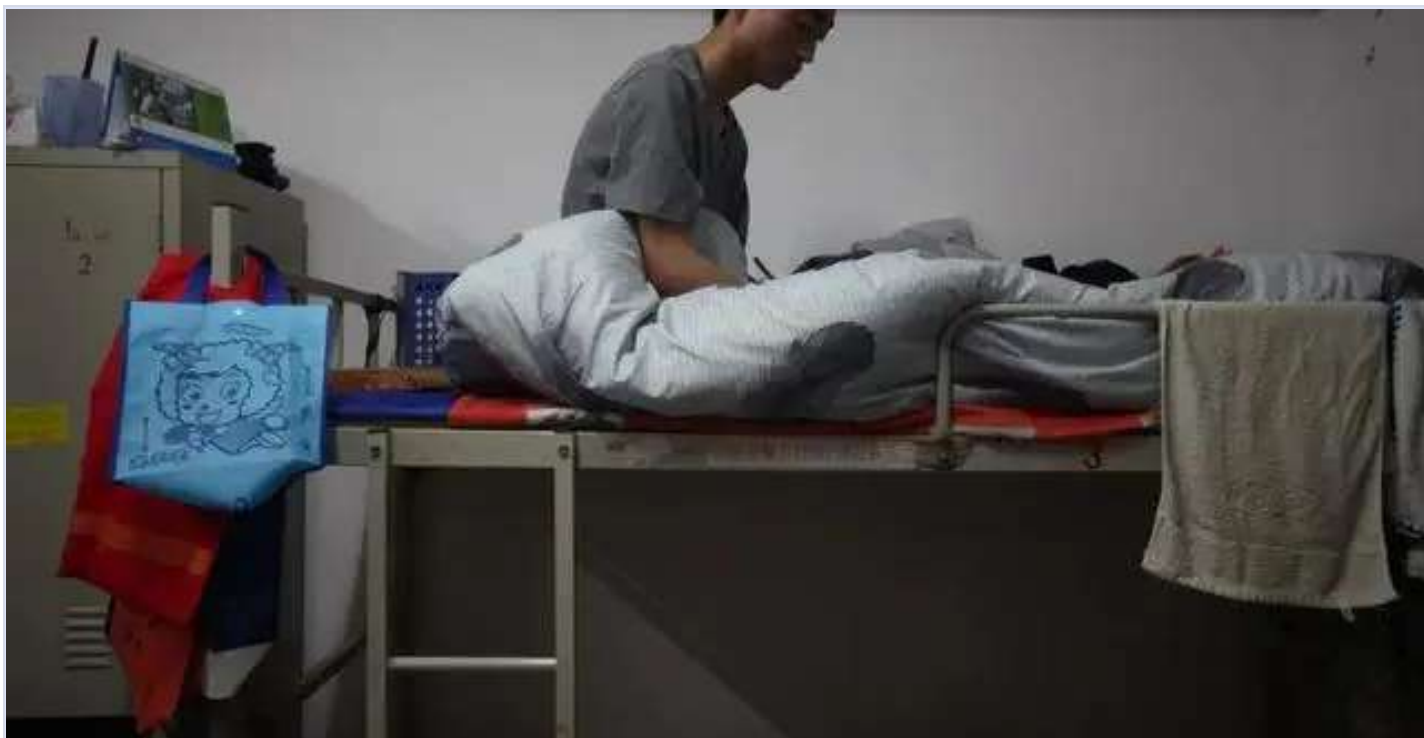
富士康工人在宿舍

利润下降迫使富士康加速争夺市场份额，积极寻求更有利可图的劳动力，它将目光投向了廉价劳动力市场庞大的印度、越南等地。8月，富士康在印度追加投资，开设两个新厂预计增加10万个工作岗位（ 来源 ）。在越南北江，富士康也设立新工厂，而当地的工人月收入最高2000元，仅有中国的三分之一（ 来源 ）。