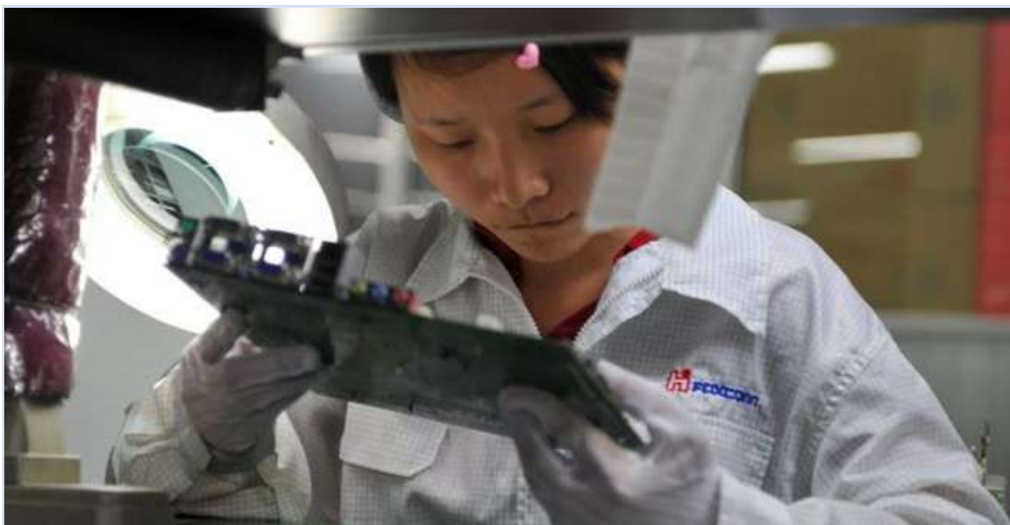
生产线上的富士康工人

对于工厂来说，以加班费为主的工资模式是节省成本的最佳方式。劳动学者Dong Yige将此模式总结为“加班时间囤积”机制，意思是管理层将加班机会囤给一小部分工人，同时维持极低的底薪标准。在国内大部分电子厂，加班都不是强制的，而是企业操纵工人的激励手段。只有那些自律、手巧、服从性强的工人才能被选中获得加班机会（ 来源1 、 来源2 ），加班成为了驯服工人的手段。