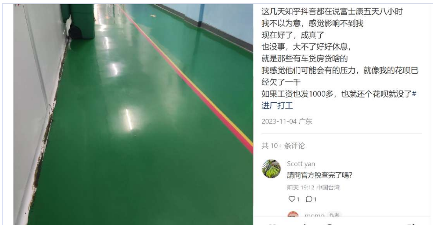
富士康工人的小红书截图

最近，富士康执行五天八小时工作制的消息引起争论。尽管富士康方面一直没有公开确认，但根据抖音（ 1 、 2 、 3 ）、贴吧（ 1 、 2 ）、小红书（ 1 、 2 ）等社交媒体上的内容，昆山、成都、深圳等地工厂已经开始推行新政策。有工人表示所在部门大砍加班时长。